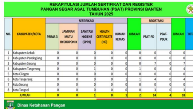
Tabel. Rekapitulasi Sertifikat dan Register PSAT Bulan Maret Tahun 2025